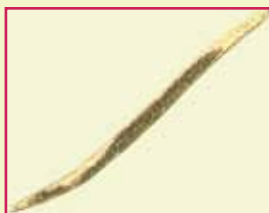
Nematodos agrandados del rosario de la papa

El nematodo del rosario es un gusano pequeño, que no se ve a simple vista y que vive en el suelo y en los tubérculos.