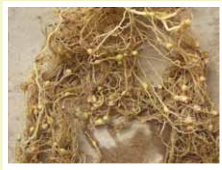
Raíz de una planta de papa con muchas bolitas como el rosario, causado por el nematodo

Este gusano se alimenta de las raíces de la papa, donde forma unas bolitas parecidas a un rosario.