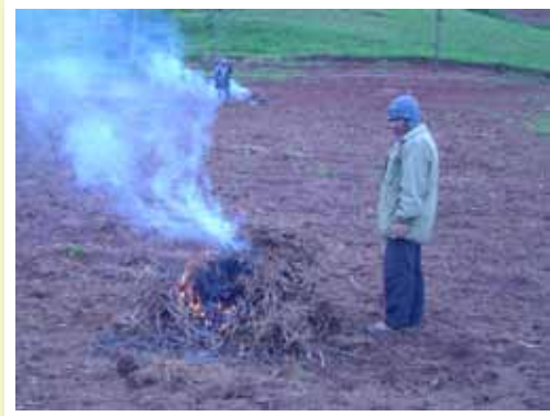
Agricultor quemando raíces para destruir los huevos de nematodos

Después de la cosecha, debemos recoger y juntar todas las raíces de papa y luego las quemamos; así podemos destruir los nematodos que están dentro las raíces.