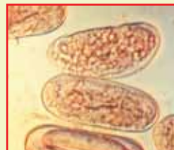
Huevos agrandados del nematodo del rosario de la papa