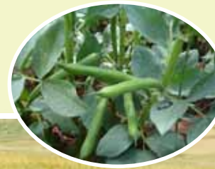
Incorporación de abono verde al suelo