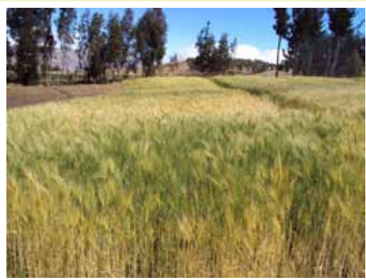
Cultivo trampa, cebada IBTA-80

Los nematodos pueden entrar a las raíces de un cultivo trampa como la cebada (variedad IBTA-80), pero no se pueden alimentar, tampoco reproducir y al final mueren. Por eso, después de la papa, debemos sembrar un cultivo trampa.